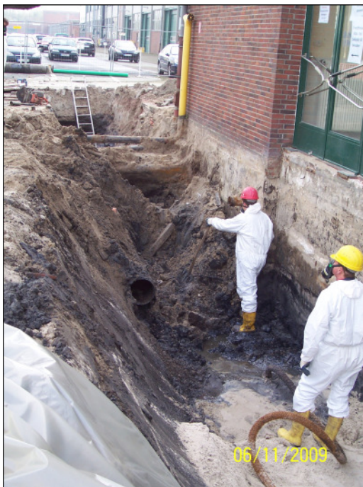
Abb. 1: Arbeiten in kontaminierten Bereichen