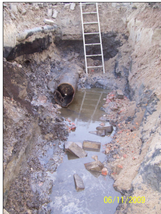
Abb. 2: Kontaminierter Bereich